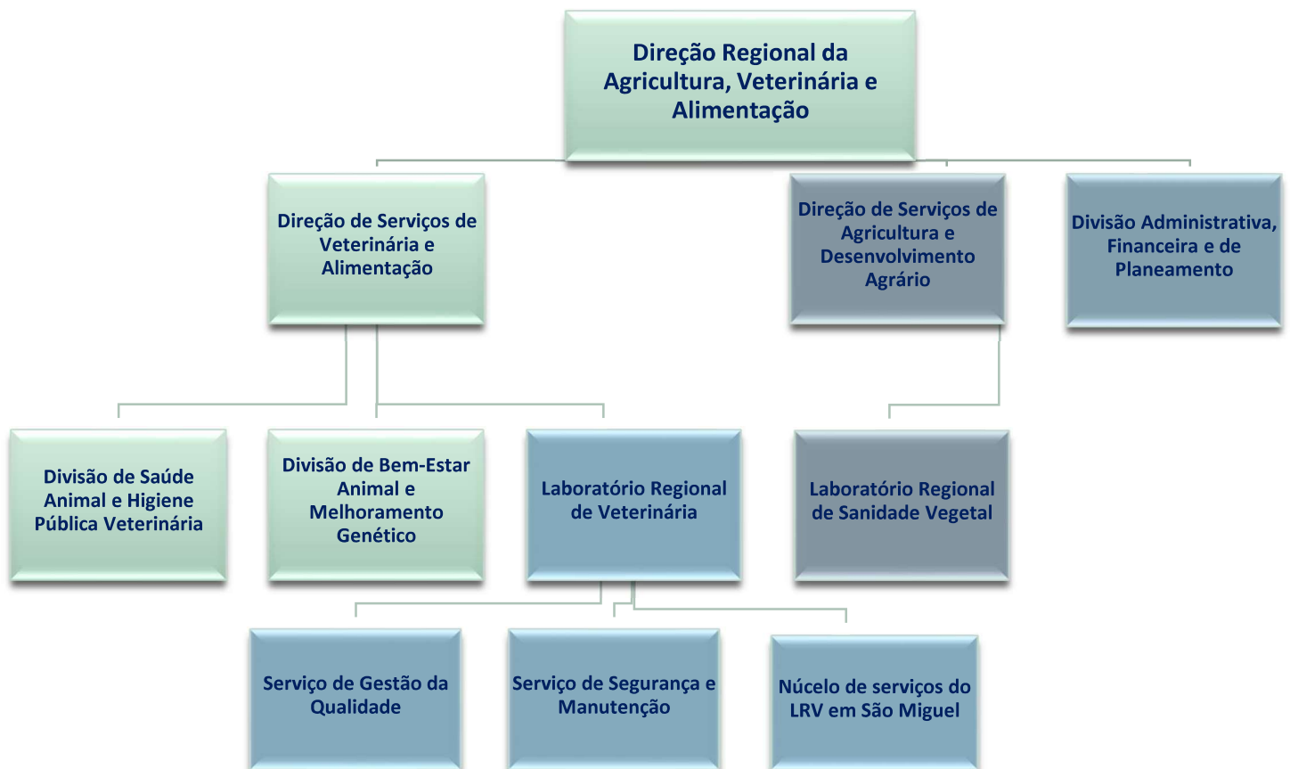
Figura 1: Organograma da DRAVA

De modo a dar cumprimento às suas competências, a DRAVA integra duas direções de serviços - Direção de Serviços de Agricultura e Desenvolvimento Agrário (DSADA) e a Direção de Serviços de Veterinária e Alimentação (DSVA) - e uma Divisão Administrativa, Financeira e de Planeamento (DAFP), conforme se pode observar mais detalhadamente no organograma abaixo apresentado.