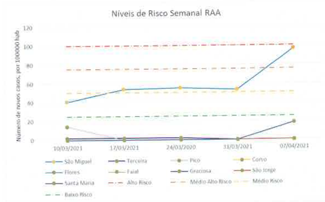
Gráfico 2 – Evolução do Nível de risco na RAA

Com o aumento do número de casos em São Miguel, a RAA apresenta um nível médio de risco, com 54 novos casos por 100000 habitantes. Esta situação é motivada pela situação de Médio Alto Risco vivida na Ilha de São Miguel, local de cerca de 60% de toda a população da RAA, mantendo as restantes Ilhas em situação de muito baixo risco.