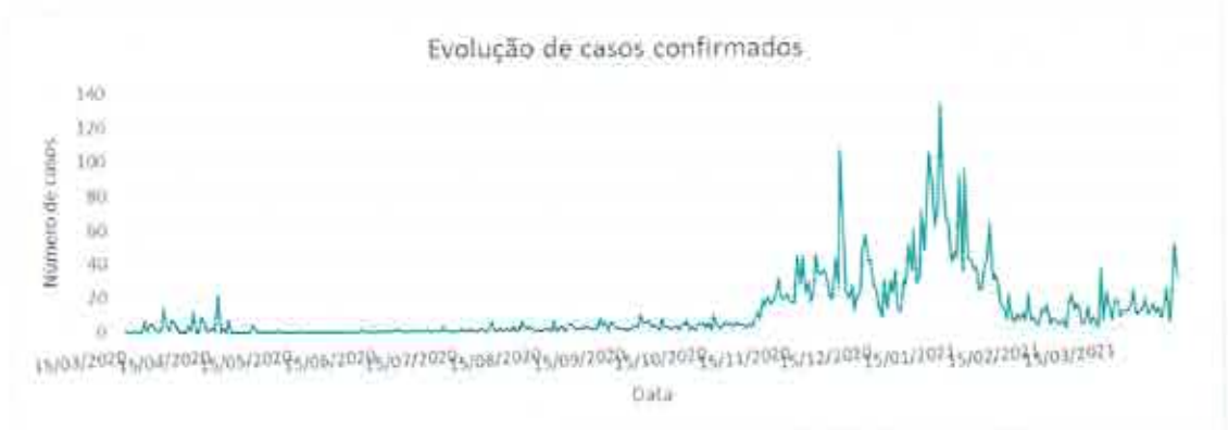
Gráfico 1 – Curva Epidemiológica na RAA

Conforme o gráfico 1, verifica-se uma estabilização do número de novos casos diários entre 0 e 20 casos por dia, desde meados de fevereiro. No entanto, e conforme ilustrado no gráfico 1, tem surgido um aumento de casos nos últimos dias, motivando um agravamento da situação epidemiológica na ilha de São Miguel, local onde se concentram a quase totalidade de casos novos, sendo a maioria associada à nova variante do Reino Unido (VOC).