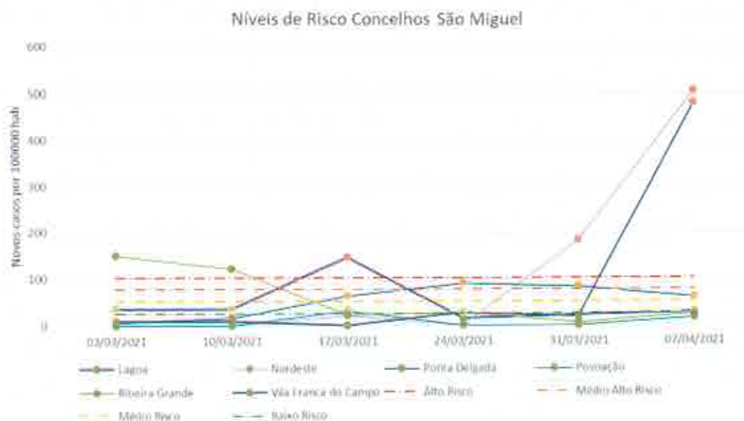
Gráfico 3 – Evolução do Nível de Risco dos Concelhos da Ilha de São Miguel

Na Ilha de São Miguel podemos observar um aumento do nível de risco dos Concelhos do Nordeste e de Vila Franca do Campo, passando para Alto Risco, enquanto que o concelho de Ponta Delgada baixou de Médio Alto risco para Médio Risco e os restantes concelhos se mantêm em situação de Baixo e Muito Baixo Risco.