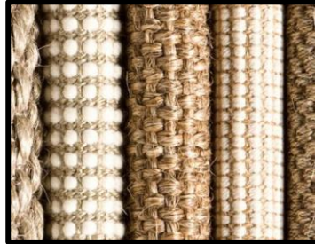
Figura 2 - Fibras naturais