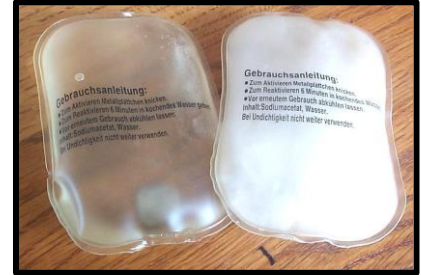
Figura 3 - PCM's - Phase Change Materials