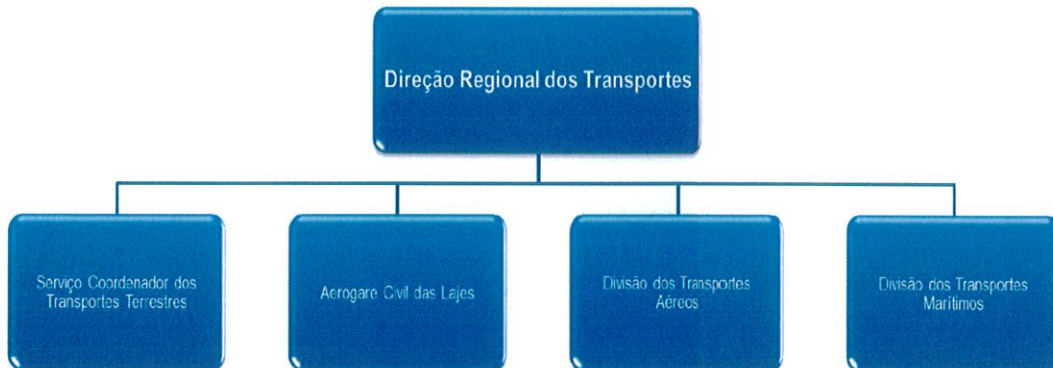
Figura 1: Organograma

A Direção Regional dos Transportes tem os serviços repartidos por quatro unidades orgânicas: Divisão dos Transportes Aéreos, Divisão dos Transportes Marítimos, Serviço Coordenador dos Transportes Terrestres e Direção da Aerogare Civil das Lajes na Terceira.