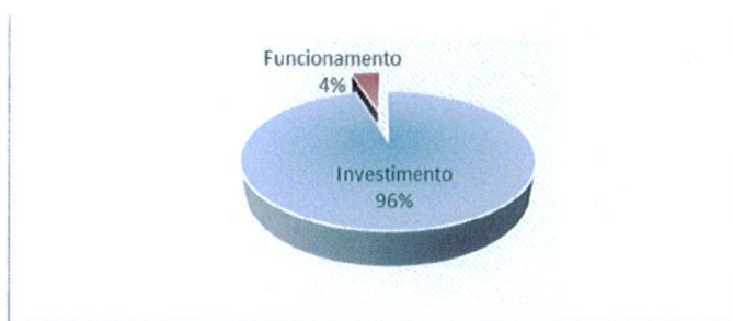
Figura 2: Distribuição percentual da despesa paga

(Ver mapa 7.1 – Controlo orçamental da despesa para o período de 21/11 a 31/12/2016 no documento de Prestação de Contas).