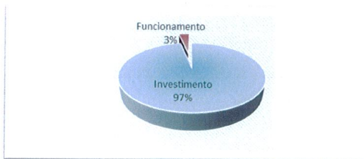
Figura 2: Distribuição percentual da despesa paga

(Ver mapa 7.1 – Controlo orçamental da despesa para o período de 01/01 a 20/11/2016 no documento de Prestação de Contas).