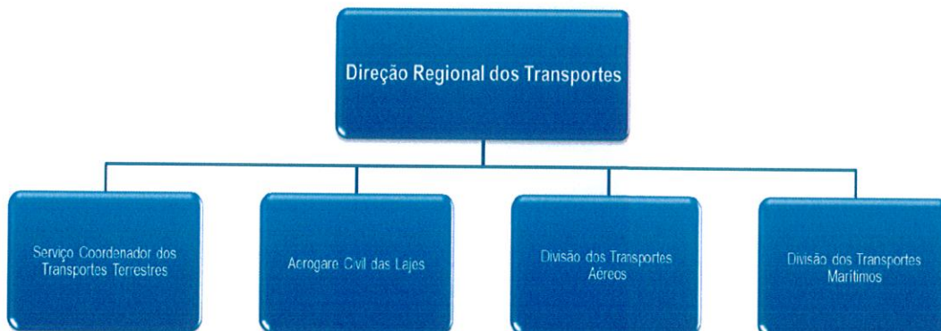
Figura 1: Organograma

A Direção Regional dos Transportes tem os serviços repartidos por quatro unidades orgânicas: Divisão dos Transportes Aéreos, Divisão dos Transportes Marítimos, Serviço Coordenador dos Transportes Terrestres e Direção da Aerogare Civil das Lajes na Terceira.