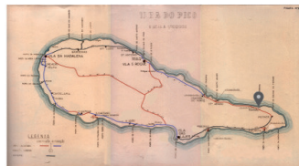
E.R. N.º 1-2ª - Ribeirinha