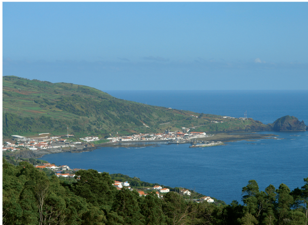
Miradouro da Cascalheira