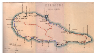
E.R. N.º 1-2ª - S. Roque