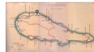
E.R. N.º 1-2ª - S.ta Luzia