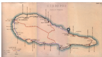
E.R. N.º 1-2ª - Aqueduto da Ribeira do Império - Prainha de Baixo