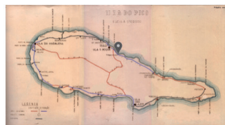
E.R. N.º 1-2ª - S. Miguel Arcanjo