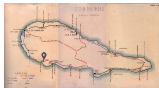
E.R. N.º 1-2ª - S. Mateus