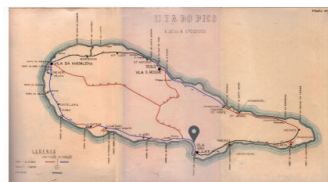
E.R. N.º 1-2ª - Ribeira do Meio