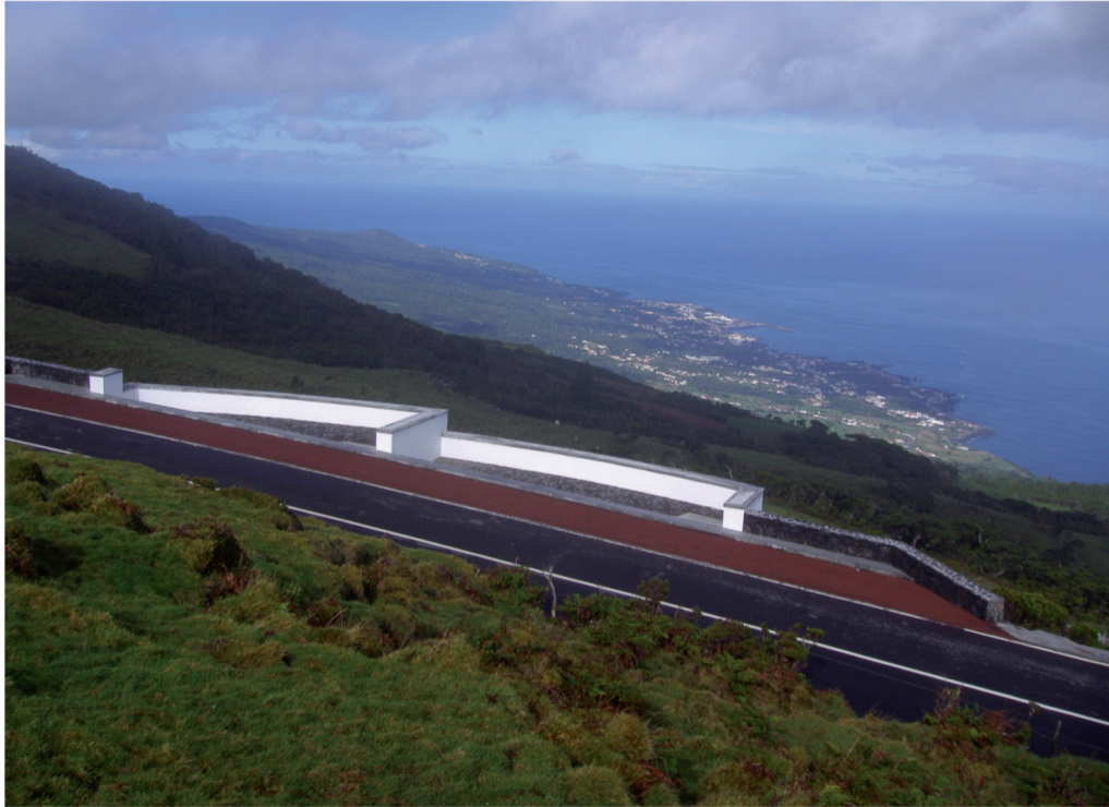
Miradouro do Corr'Água