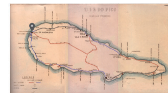
Rotunda do Carmo - E.R. N.º 1-2ª - Madalena