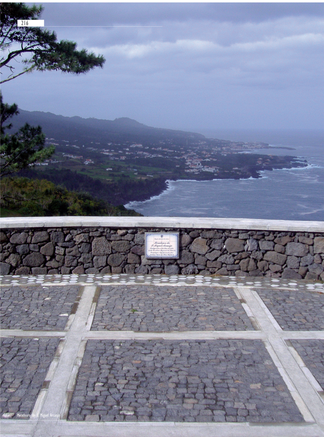
Miradouro de S. Miguel Arcanjo