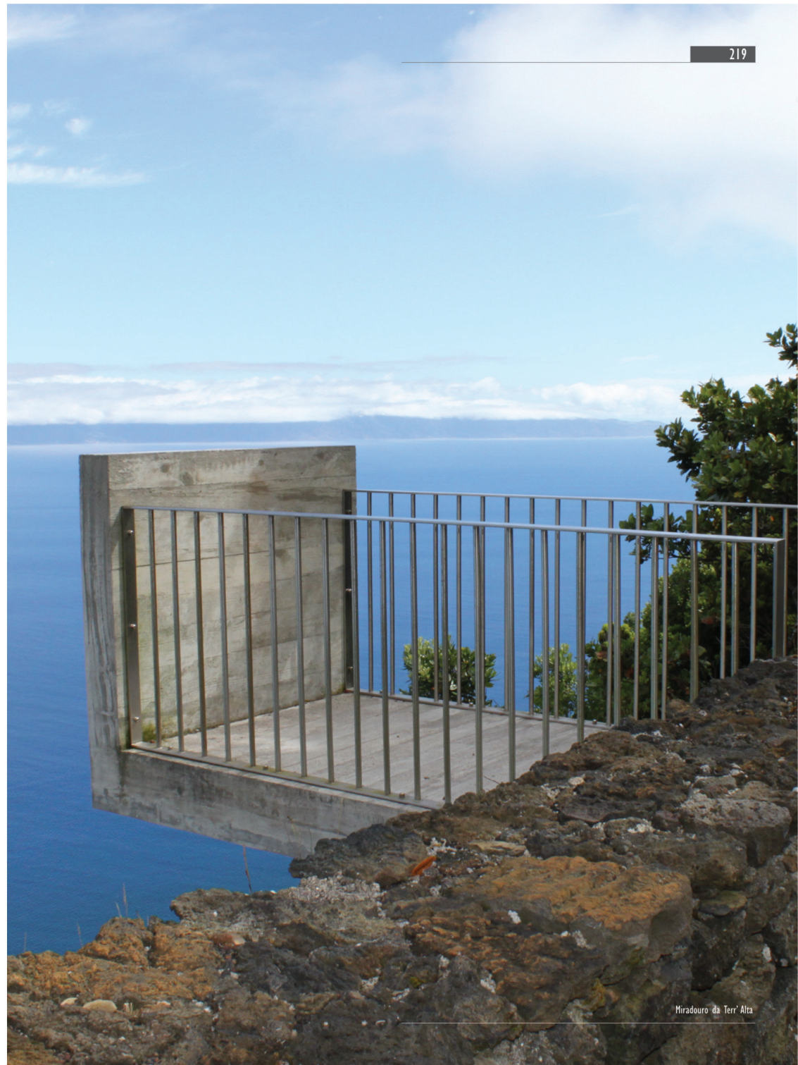
Miradouro da Terr'Alta