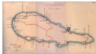
E.R. N.º 1-2ª - Prainha - Canto d'Areia