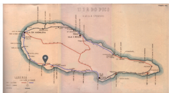
E.R. N.º 1-2ª - S. Mateus