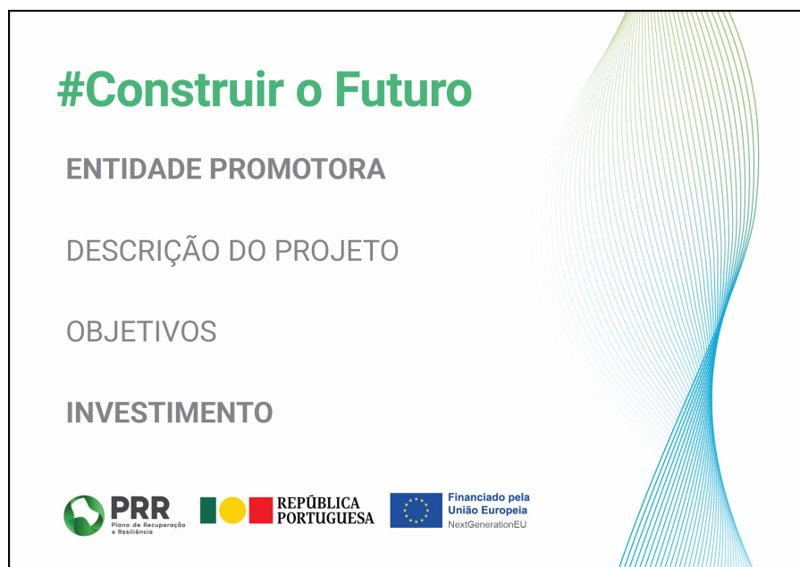
Modelo 1 - A3 ao baixo: 42 cm (L) x 29,7 cm (A)