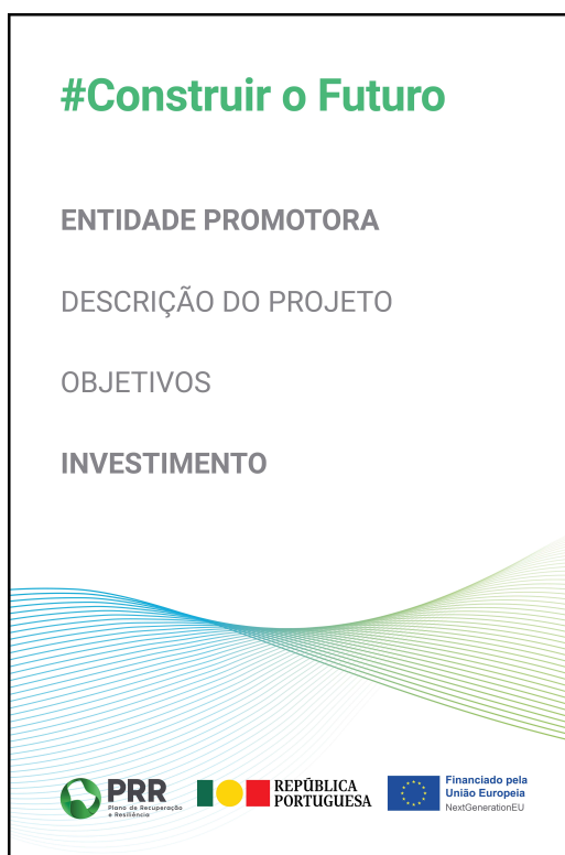
Modelo 2 - Dimensões - 100cm (L) x 150cm (A)

Em determinadas situações é possível substituir um cartaz por um ecrã eletrónico, conforme indicado no ponto anterior.