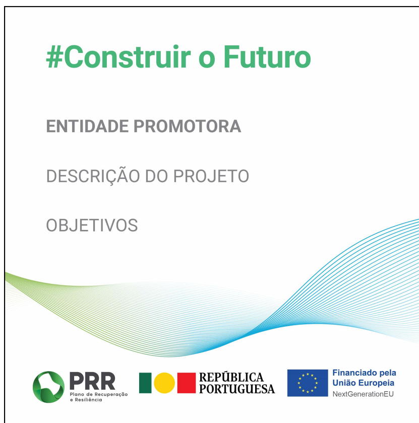
Modelo 3 – Formato 40cm (L) x 40cm (A)

Os painéis ou placas permanentes devem manter-se durante a existência do projeto. No caso de não ser possível, devem manter-se pelo período mínimo de 10 anos.