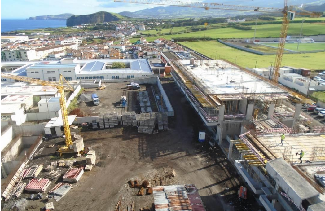
Fotografia 7 – Vista da Grua Torre (Alçado Nascente)