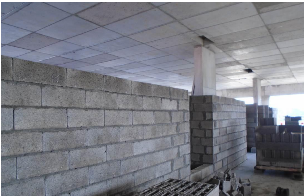
Fotografia 4 – Execução dos Panos de Alvenaria Interiores do Piso 1 – Bloco A