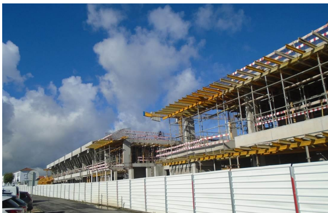
Fotografia 2 – Cofragem das Caleiras