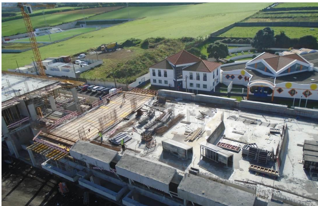
Fotografia 10 – Vista da Grua Torre (Alçado Sul)