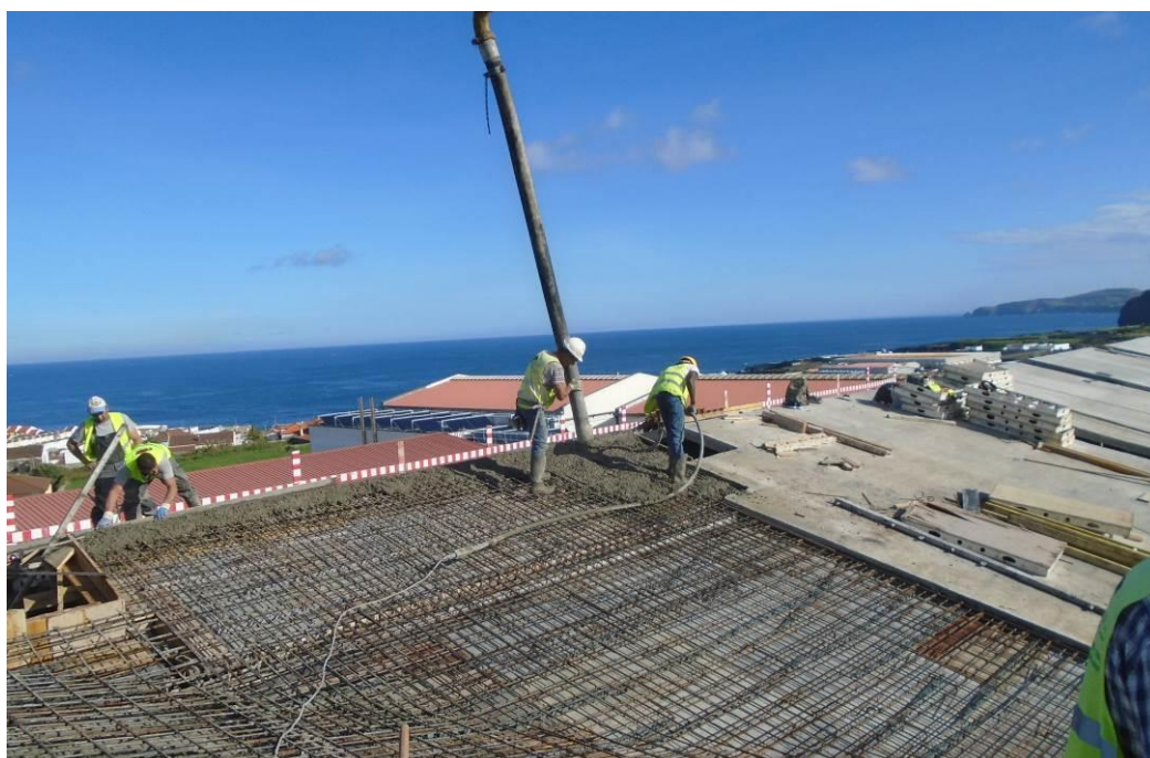
Fotografia 6 – Betonagem da Laje de Cobertura – Bloco A