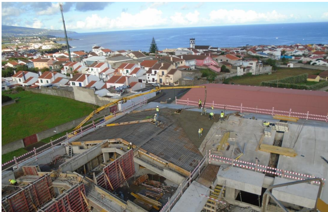
Fotografia 8 – Vista da Grua Torre (Alçado Poente)