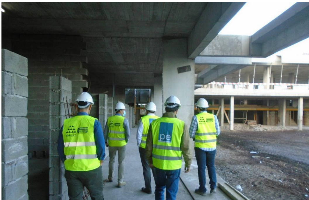
Fotografia 1 – Visita do Projetista à Obra