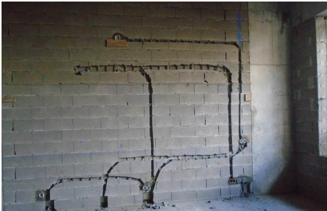
Fotografia 3 – Execução das Redes Técnicas – Bloco A