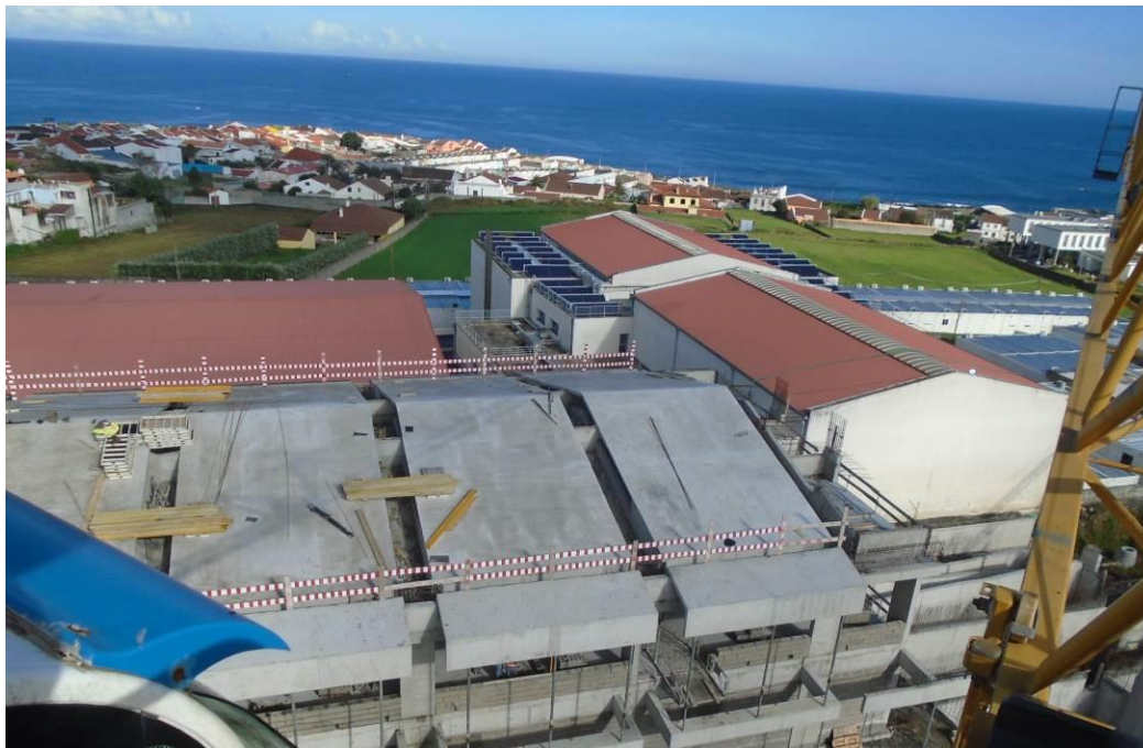
Fotografia 9 - Vista da Grua Torre (Alçado Norte)