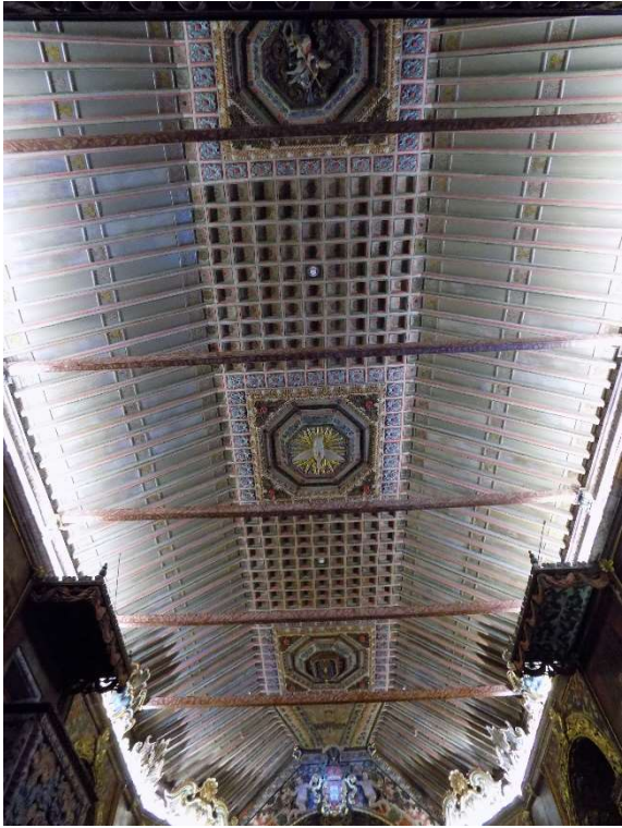
Teto da nave após a intervenção de conservação e restauro