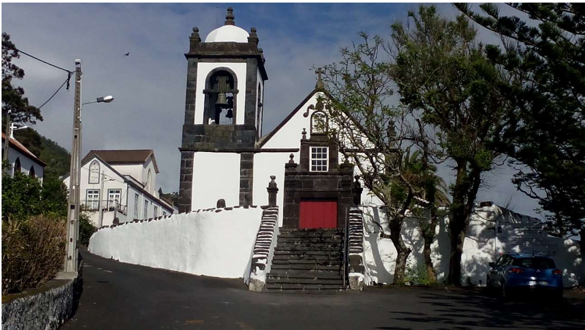
Igreja de Santa Bárbara das Manadas