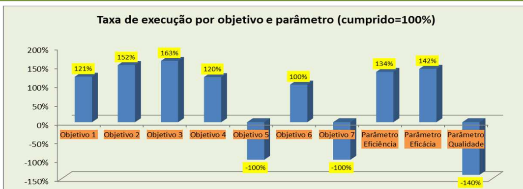
Taxa de execução por objetivo e parâmetro (cumprido=100%)

OE 5: Melhorar o processo de informação do sistema de solidariedade e segurança social