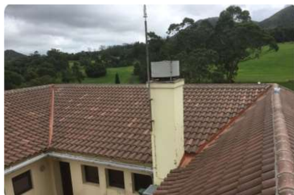
IMAGEM 10 E 11: INSTALAÇÕES CAMPO GOLFE S. MIGUEL

A atividade de Golfe é uma das atividades da Ilhas de Valor, S.A. que gera receitas próprias, contudo face ao impacto causado pela COVID-19 foi registado uma quebra de receitas de 53%.