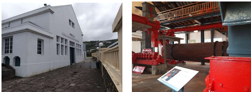
IMAGEM 7 E 8: MUSEU DA FÁBRICA DA BALEIA DO BOQUEIRÃO

Por conta do Contrato Programa celebrado para a Coesão, são também assumidos os encargos com o respetivo pessoal e todas as despesas de funcionamento do Museu da Fábrica da Baleia do Boqueirão nas Flores.