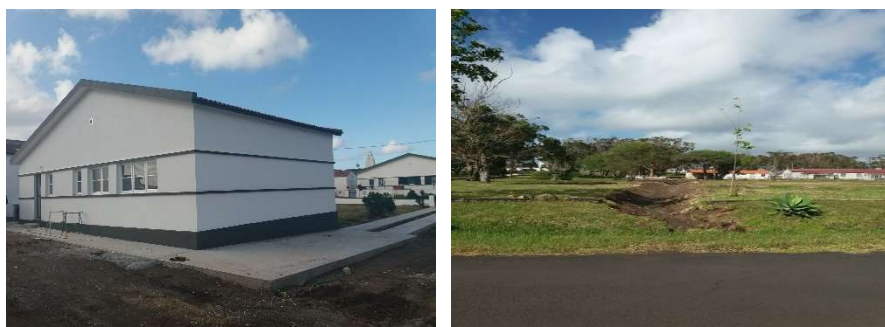
IMAGEM 1 E 2: ZONA DO AEROPORTO DE SANTA MARIA

Ao longo de 2020 desenvolveram-se diversas ações de manutenção e dinamização dos diversos espaços públicos e edifícios comerciais, tendo em vista o aproveitamento para efeitos de turismo, comércio, indústria e/ou serviços e sua rentabilização, bem como trabalhos de limpeza e manutenção das áreas circundantes e zonas públicas do Lugar do Aeroporto e ainda a dinamização dos espaços e áreas.