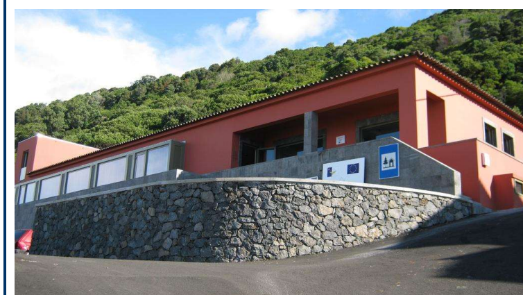
IMAGEM 9: POUSADA DA JUVENTUDE DA CALDEIRA DO SANTO CRISTO

Em maio de 2019 foi celebrado um Contrato de cedência de exploração entre a Região Autónoma dos Açores, Pousada da Juventude da Caldeira de Santo Cristo, Lda e a sociedade PJA - Pousadas de Juventude dos Açores, S.A., em substituição ao Contrato de cessão de exploração celebrado a vinte e nove do mês de julho do ano de 2011, atendendo a que o atual modelo de exploração se encontrava desajustado dos objetivos definidos pelo Governo Regional para as pousadas da Região, de uma gestão inteiramente privada, é aprovado um único contrato de cedência de exploração, que substituiu o conjunto de títulos contratuais atualmente em vigor conforme a Resolução do Conselho do Governo n.º 46/2019 de 2 de abril de 2019. Apesar de estar orçamentado um investimento de cerca de 55.000,00 € para o ano de 2020, face à situação de pandemia, não foi possível efetuar qualquer investimento nessa unidade hoteleira, prevendo-se para o ano de 2021.