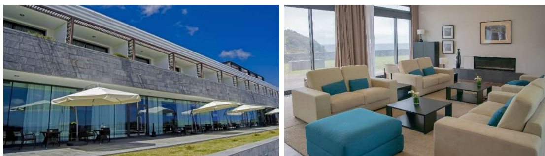
IMAGEM 5 E 6: HOTEL DA GRACIOSA E FLORES

Tal como previsto no nosso Plano de Atividades para 2020 foram efetuadas pequenas intervenções de reabilitação e melhoria no Hotel das Flores.