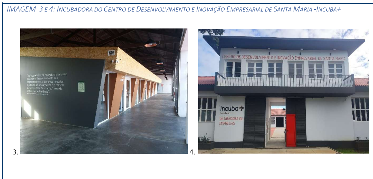
IMAGEM 3 E 4: INCUBADORA DO CENTRO DE DESENVOLVIMENTO E INOVAÇÃO EMPRESARIAL DE SANTA MARIA -INCUBA+

Também no ano de 2020 foram concluídos outros trabalhos na Incubadora, nomeadamente pavimentos e pequenas obras de ajustamento em espaços do edifício.