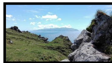
Trilho da "Cara do Índio", Corvo, Açores

O Comité das Regiões Europeu, em parceria com a Comissão Europeia, no âmbito da Plataforma Técnica Conjunta para a Cooperação no domínio do Ambiente, organiza uma conferência intitulada "Desenvolvimentos nas energias renováveis e a legislação no domínio da natureza". Pretendem-se promover as melhores formas, mais inteligentes e mais eficazes de conciliar os desenvolvimentos das energias renováveis com as Directivas Aves e Habitats, especialmente Natura 2000. Mais detalhes em breve.