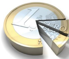
Imagem aqui .

O Quadro Financeiro Plurianual pós 2020 será apresentado no dia 2 de maio. Até lá, os dirigentes tentam influenciar a Comissão Europeia para que faça uma proposta consonante com os interesses dos seus representados. Após a apresentação da proposta, os Estados-Membros, ao nível do Conselho, e o Parlamento Europeu terão o poder de alterar esta proposta. Nesta fase, multiplicam-se as reuniões tendentes a reforçar argumentações, o que incluiu uma reunião entre o Primeiro-Ministro, António Costa, e o Presidente do Governo dos Açores, Vasco Cordeiro. Mais no Açores24 . Outras declarações sobre o futuro QFP na CRPM , GACS e GACS . Fale sobre este assunto nas redes sociais, #MFF .