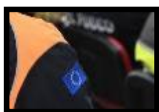
gestão da crise e solidariedade