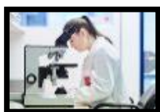
investigação e inovação