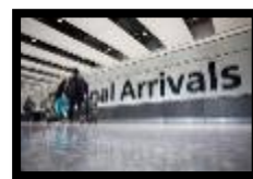
viagens e transportes