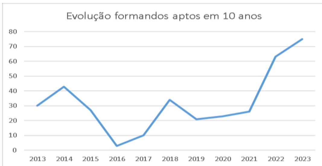
Gráfico de formandos inscritos, aptos e não aptos em 10 anos