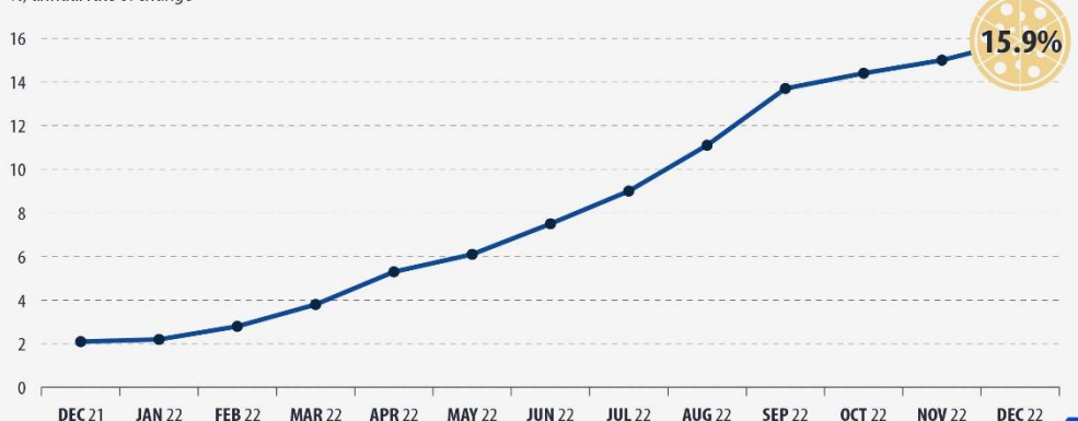
Inflation rate for pizza and quiche in the EU %, annual rate of change

Pizza and quiche (01115): includes farinaceous-based (flour-based) products prepared with meat, fish, seafood, cheese, vegetables or fruit. The code refers to the store-bought varieties eaten at home.